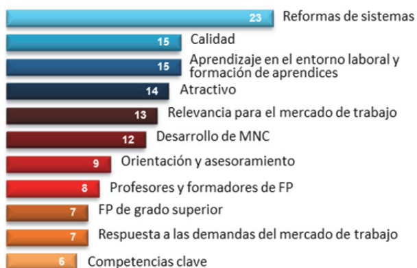
Figura 2. Enfoque de la reforma de las políticas de FP en 2010-14 (número de países)

El alto nivel de desempleo entre los jóvenes ha hecho que el fomento del aprendizaje y la movilidad de los adultos ocupen una posición menos destacada. España ha firmado acuerdos bilaterales con Alemania, Portugal y el Reino Unido para facilitar las estancias de estudio y de trabajo en empresas extranjeras.